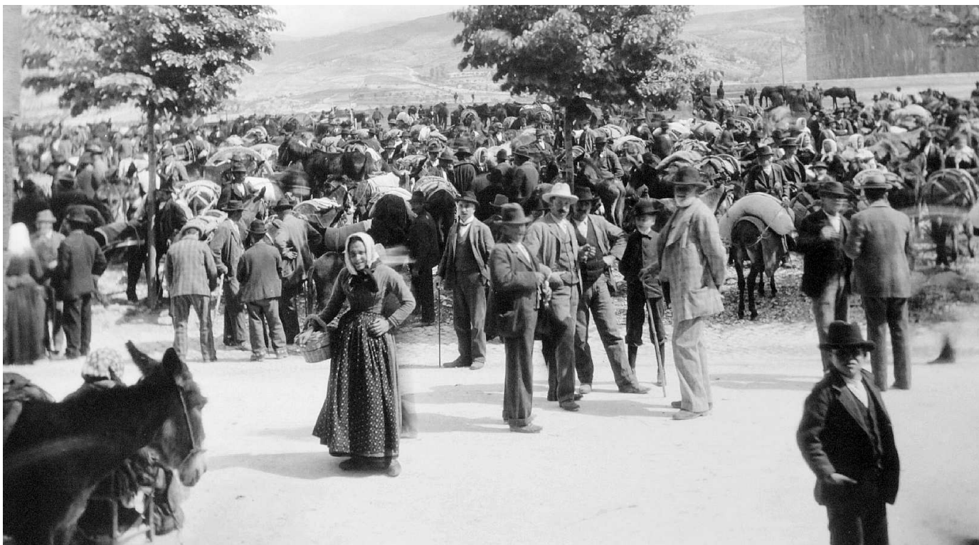
Un mercato di bestiame in Abruzzo nelle foto di Hasby