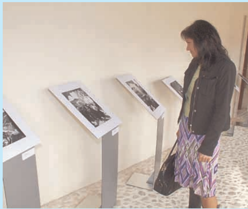
La mostra inaugurata nel chiostro dell'ex convento di San Domenico

All'Aquila per ammirare gli scatti abruzzesi dell'archeologo