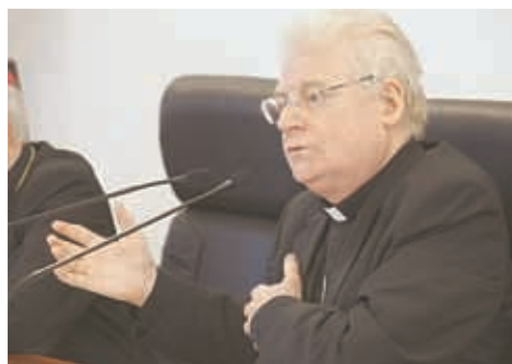
Il cardinale Angelo Scola