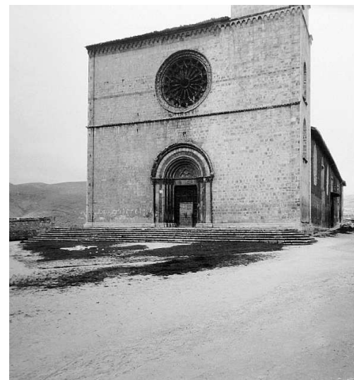
A destra una chiesa nell'Aquilano